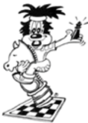
Schaken, denken en doen I

De komende weken ga je je verdiepen in een eeuwenoud spel of, zoals je wilt, een eeuwenoude sport. Het is buitengewoon interessant omdat elke wedstrijd of spel weer anders zal gaan verlopen, dus je hoeft je geen moment te vervelen. Het is spannend, het scherpt je geestelijke vermogens, helpt je om je beter te concentreren en leert je om te accepteren dat je ook wel eens verliest.